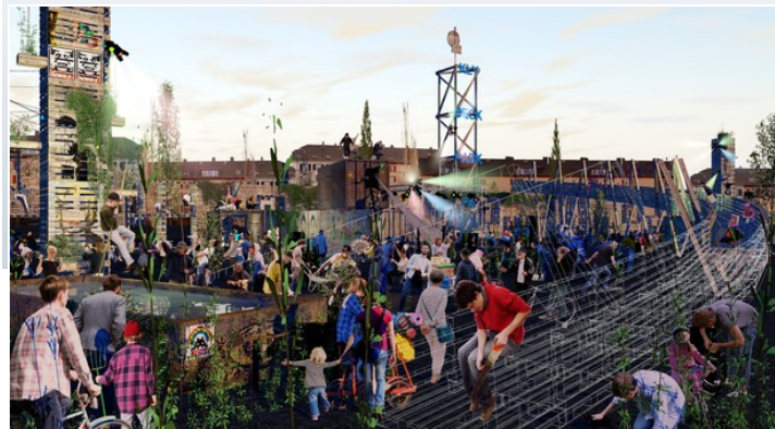
So stellt sich der Verein Shift Mode den Holzpark vor. Quelle: Visualisierung Atelier Schuwey

Auch für ein zweites frei gewordenen Hafenareal am Basler Klybeckquai hat der Kanton eine Zwischennutzung vereinbart: Der Verein Shift Mode darf ab Mai 12'500 Quadratmeter Ex-Migrol-Flächen bis 2019 nutzen. Daneben bleibt auf 2500 Quadratmeter die »Wagenplatz"-Besetzung geduldet.