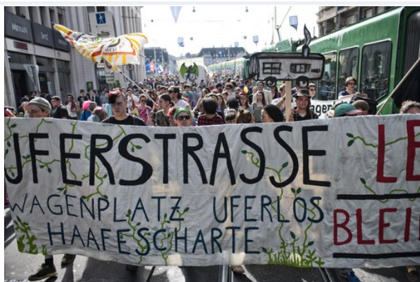
Die Demonstrierenden - mehrheitlich zwischen 18 und 40 Jahren alt - bewegten sich nach 16 Uhr vom Marktplatz ins Kleinbasel. (Archivbild).

Rund 200 Personen haben am Sonntagnachmittag in Basel an einer Demo zur Unterstützung der «Wagenplatz»-Besetzung eines Hafens teilgenommen. Der Tram- und Busbetrieb wurde teils kurz beeinträchtigt.